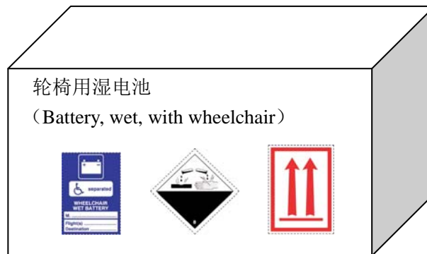
图B.3 非防漏型电动轮椅、助行器的电池包装外部标记和标签